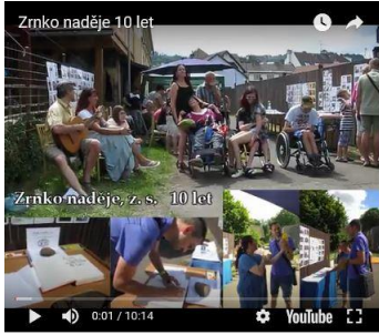
VIDEO TV Semily (4:09)

02.06.2018 Oslava k 10 výročí od založení spolku Zrnko naděje. V Jílovecké ulici Semily byla připravena prezentace o ocelkové činnosti. Prezentace dokumentů za 10 let činnosti v pdf. Více zde: https://jedeme-bez-barier.webnode.cz/zrnko-nadeje-10-let/